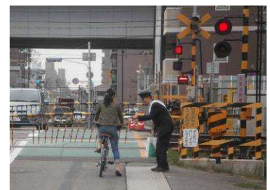
踏切道での啓発活動