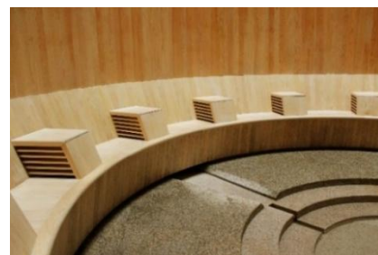
椅子のヒジ置き部分から冷風が取り込まれる。