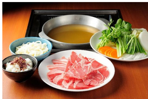
50年目の挑戦！ シェフこだわりのダシで食べるヘルシーラムしゃぶ ダシが決め手！ラムしゃぶ 3,900円(税込)