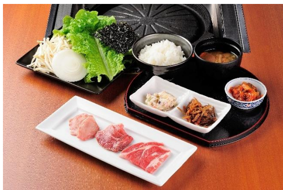
当店人気のラム肉3種がお得な価格で楽しめる！ 祝！50周年ラムランチ 1,976円(税込) ※ランチタイムのみ注文可能。14時LO。