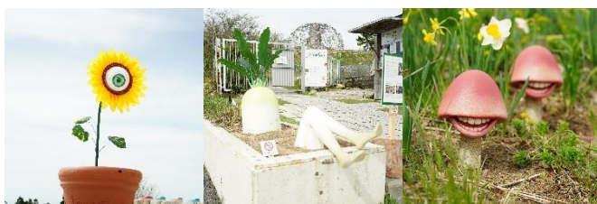
現在開催中の「きみよい植物展」の様子