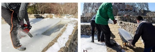
①「氷棚」にできた氷を切り出し、運び出します。