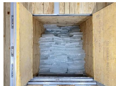
1月26日(月)に 氷を貯蔵した氷室の様子

【備考】 普段は非公開の氷室内部を見学できる、年に1度だけの貴重な機会です。また見学会後、六甲枝垂れで開催中のイベント「きみよい植物展」も無料でご鑑賞いただけます。ぜひお越しください。