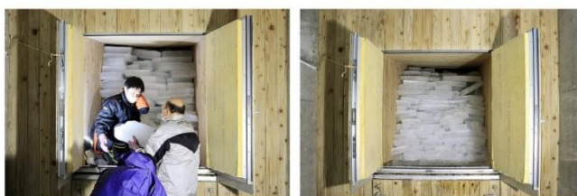
②展望台内部にある「氷室」に運び、夏まで氷を貯蔵します。

毎年、六甲枝垂れの開業日である7月13日になると、氷を貯蔵した「氷室」の扉を開放し、六甲山上に吹く風を取り込む「氷室開き」を行います。氷室を通った風は冷気となり、展望台内部の「風室(ふうしつ)」にある椅子のヒジ置き部分から風室内へ取り込まれます。風室内は神戸市街地と比べて約10度気温が低く、ひんやりと心地良い空間が広がります。この電力を一切使用せずに、自然の力だけで涼が楽しめる体験が「冷風体験」です。