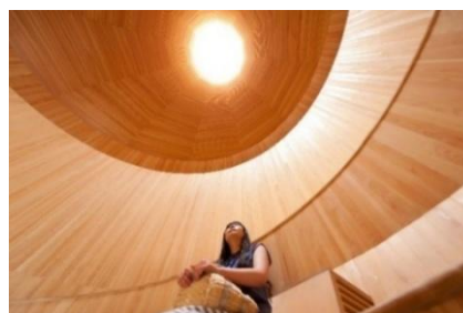
「風室」の天井部分から空気が排出される。