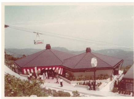
創業当時の様子(1976年)