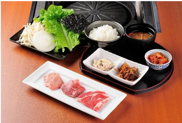
祝！50周年ラムランチ 1,976円