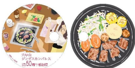
丸形うちわ(表・裏)

9月末までに当店でお食事いただいたお客様全員にノベルティとして、50周年記念デザインのうちわをプレゼント! ぜひ、ご来店の際にお持ち帰りください。