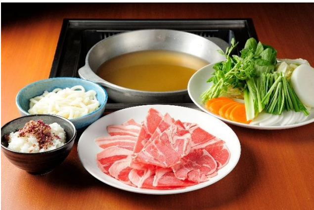
ダシが決め手！ラムしゃぶ 3,900円