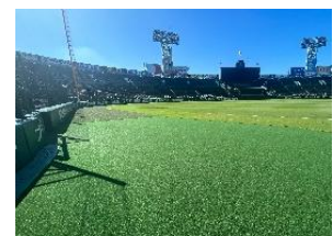
3 塁側人工芝エリア