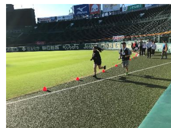
【前回開催時の様子】