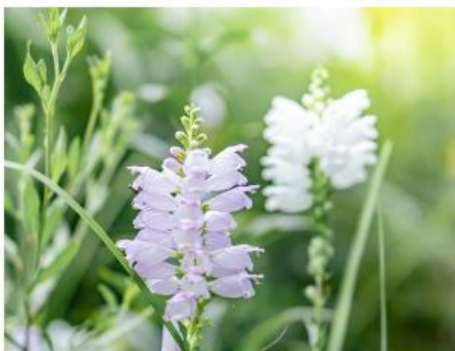
ハナトラノオ(7月上旬～8月中旬)