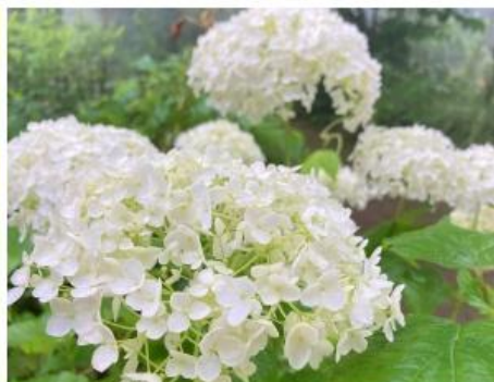
アナベル(7月上旬～8月中旬)