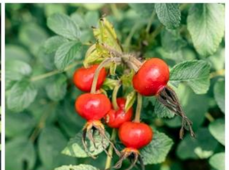
ハマナスの実(7月上旬～8月中旬)