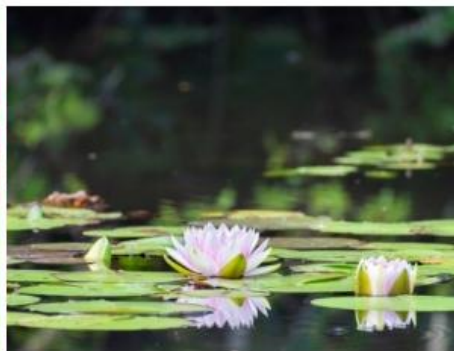
スイレン類(7月上旬～8月中旬)