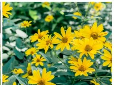
ヘリオプシス(7月中旬～8月上旬)

※天候により開花状況が変動する場合があります。最新の状況は SNS をご確認ください。 X @rokkomorinone Instagram @siki_garden