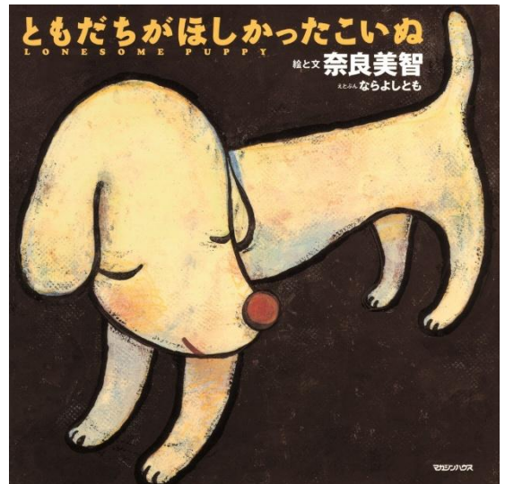
絵本『ともだちがほしかったこいぬ』(マガジンハウス)書影 Artwork: © Yoshitomo Nara

※神戸六甲ミーツ・アート2026 beyond期間の2026年8月29日(土)～ 11月29日(日)も10:20／12:20に約10分間上演。