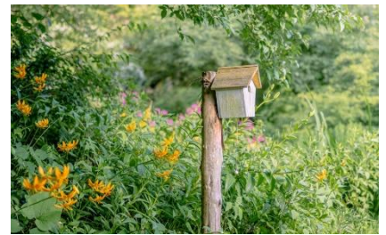
巣箱型オルゴール