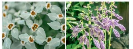
マウンテンミント (7月中旬～8月下旬) ギボウシ (7月中旬～8月中旬)