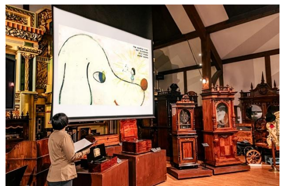
オルゴールシアター上演の様子(イメージ)