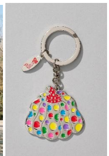
キーリング かぼちゃ ／マルチカラー 5,500円(税込) ©YAYOI KUSAMA