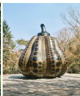
草間彌生《南瓜》 (2014年、特別寄託作品) ©YAYOI KUSAMA 画像転載不可