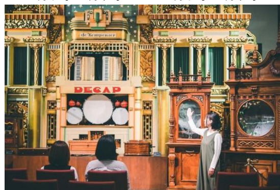
コンサートの様子(イメージ)