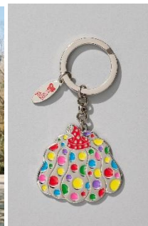
キーリング かぼちゃ ／マルチカラー 5,500円(税込) © YAYOI KUSAMA