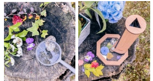
左: 植物観察クイズ 右: 木製万華鏡作り(イメージ)

【料金】 植物観察クイズ: 無料 木製万華鏡作り: 1,200円/個 (別途入場料要、所要時間約20～30分)