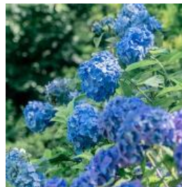
アジサイ類 6月下旬～8月中旬

【作 品】植田麻由《Daikon》、草間彌生《南瓜》(特別寄託作品)、さとうりさ《こはち》、さわひらき《shadow step》、高橋瑠璃《2人の秘密の間を過ごす》、奈良美智《Peace Head》、西田秀己《fragile distance A-A', B-B', C-C' (point A point B)》