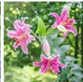
ユリ類 6月下旬～8月中旬