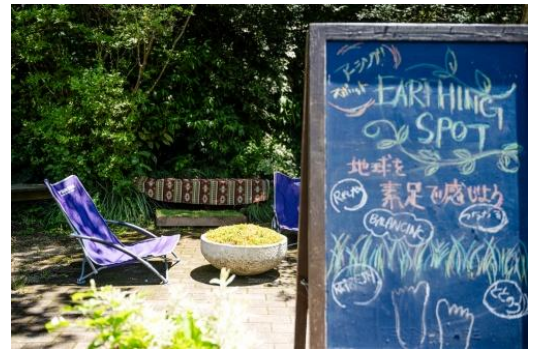
アーシング体験(イメージ)