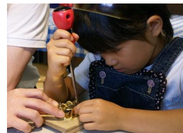
オルゴール組立体験の様子