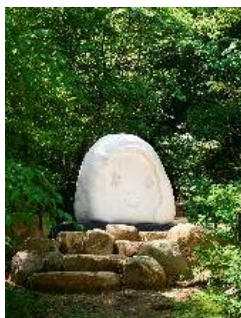
奈良美智《Peace Head》 Artwork © Yoshitomo Nara