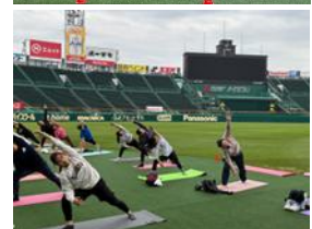
3塁側人工芝エリアでのヨガ （前回開催時の様子）