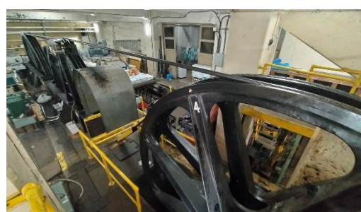
巻上場内の巻上装置（直径4mの大滑車）