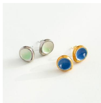
植物園限定色のピアス・イヤリング ¥5,500-(税込)

植物園に咲く「ヒマラヤの青いケシ」「エーデルワイス」をイメージした花びより限定色