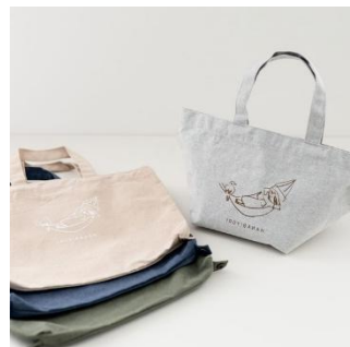
2WAY トートバッグ ¥1,980-(税込)