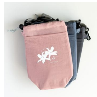
スイッチショルダー ¥1,980-(税込)