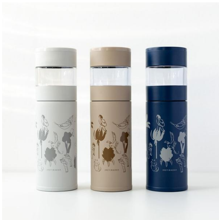
淹れたてティータイムボトル ¥3,960-(税込) 好きな時に淹れたてのお茶を楽しめる水筒