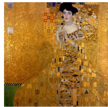
「アデーレ・ブロッホ=バウアーの肖像 I」