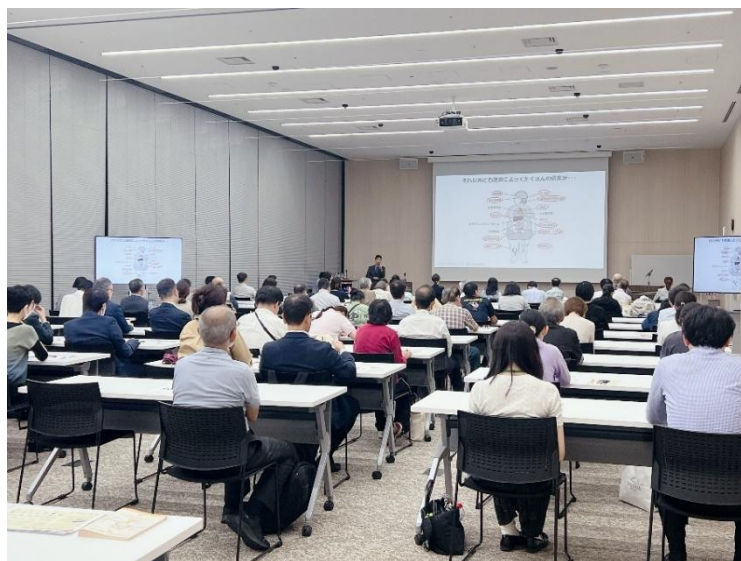
前回開催の様様（2024年10月）