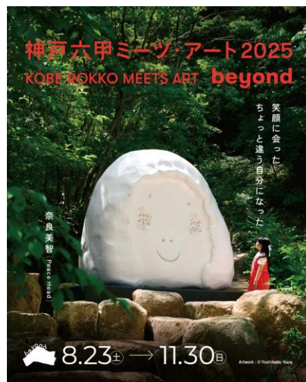
Artwork: © Yoshitomo Nara