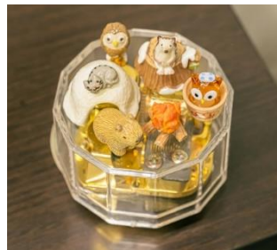
冬のお薦め飾り付け小物例

オルゴール職人のサポートのもと、自分だけの音色のオルゴール作りが体験できます。お好みの曲、ケース、コース(一般コース、上級コース)を選んで、完成したオルゴールは持ち帰りできます。下記日程は、特設のこたつ席(1台、先着順)で、あたたまりながらじっくり体験できます。冬にお薦めの飾りつけ小物もご用意しています。