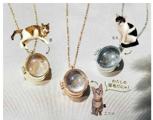
思い出を詰め込む 猫毛を入れられるロケットペンダント

※価格は全て税込です。※金額表記のないイベントは入場料のみで参加できます。※価格や在庫状況が急遽変更になる場合があります。