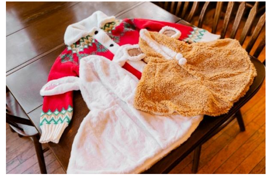
あったかウェア貸出(イメージ)