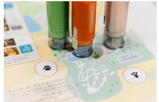
足跡スタンプラリー(イメージ)