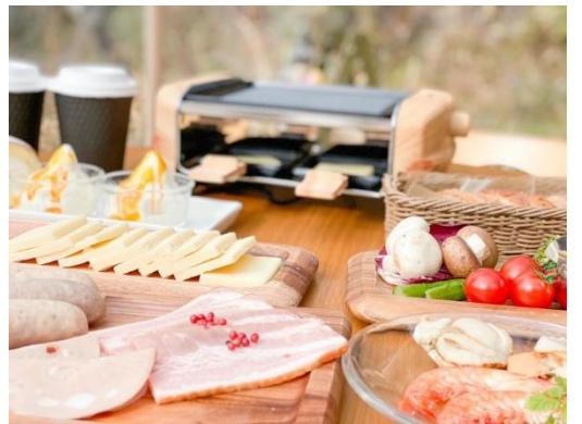
ラクレットチーズグリルセット(イメージ)