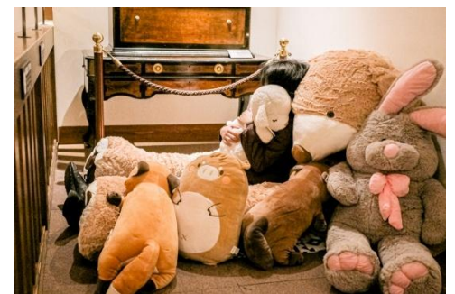
ぬいと寝そべりコンサートルーム(イメージ)