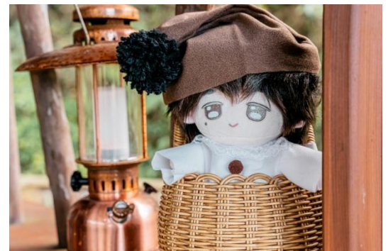
めい撮り(イメージ)