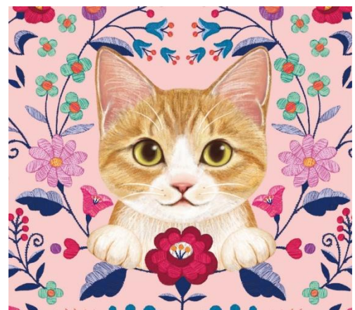
展示イラスト一例(霜田 有沙)