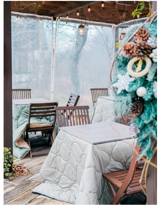
こたつ席イメージ

上記期間限定で、併設の「森の Café」メニューの「淡路オニオンカレー」(レギュラー)1,350円を猫型ごはん)で提供します。