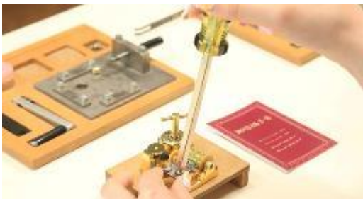
オルゴール組立体験(上級コースイメージ)