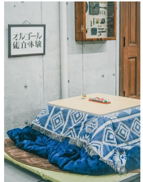
オルゴール組立体験部屋とこたつ