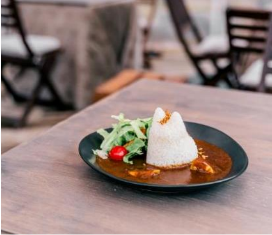
淡路オニオンカレー(レギュラー)

上記期間限定で、併設の「森の Café」メニューの「淡路オニオンカレー」(レギュラー)1,350円を猫型ごはん)で提供します。