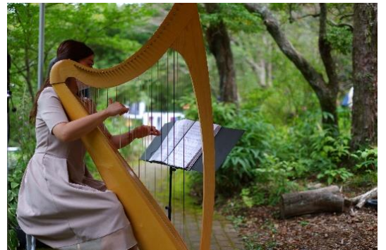
過去の SIKI ガーデンコンサート開催の様子