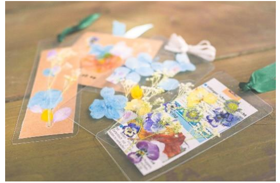
ガーデンワークショップ「押し花ブックマーカー」(イメージ)