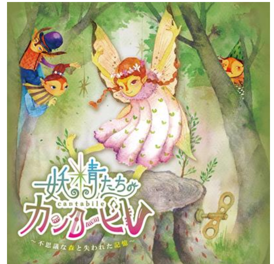
リアル謎解きゲーム『妖精たちのカンタービレ』メインビジュアル

【備考】 ・受付にてリアル謎解きゲーム参加の旨をお申し出ください。 ・本編参加には別途 ROKKO 森の音ミュージアムの入場料、ボーナスステージ参加には別途六甲高山植物園の入園料が必要です。ボーナスステージも参加される場合は、2施設共通券大人1,900円、小人950円のご利用がおすすめです。