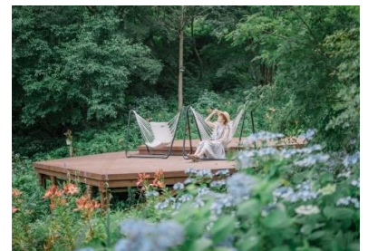
「SIKI ガーデン～音の散策路～」のアジサイとチェアモック

※価格は全て税込みです。金額の記述のないイベントは、入場料のみで参加できます。また、急遽内容を変更する場合があります。最新情報はHPをご覧ください。