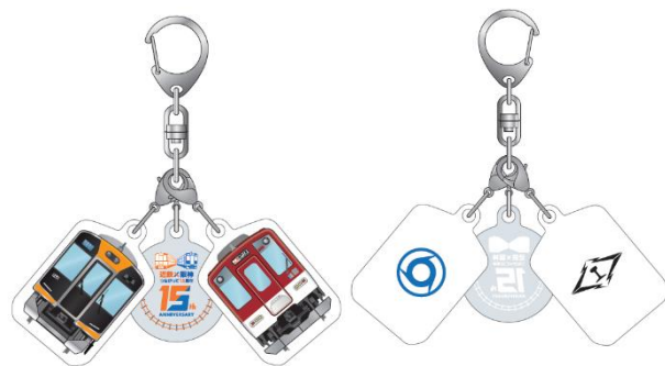
アクリルキーホルダー 近鉄 ver. 左：表、右：裏