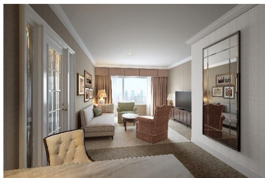
改装後のエグゼクティブスイート(リビング)のイメージ

エグゼクティブスイートの客室入口の壁紙は、お客様を出迎える温かみのある色で、その柔らかな色合いは、心地よい安らぎをもたらす旅の疲れを癒します。寝室の壁紙とカーペットはオフホワイトとウォームグレーのツートンカラーを取り入れ、ベッドエリアとリビングエリアの色を巧みに変えることで、空間の広がりや立体感を演出します。ベンチシートはボタニカルカラーの緑色に張り替え、客室のアクセントとし、客室内に自然の息吹を感じさせます。