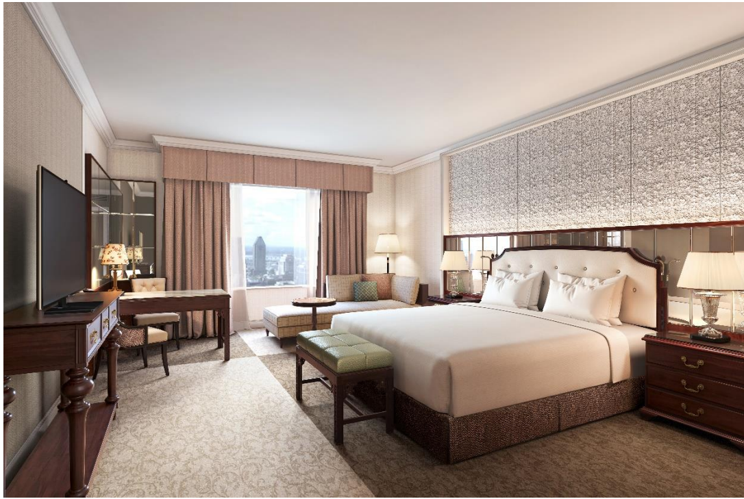
改装後のスーパリアルームのイメージ

世界有数のトラベルガイド『フォーブス・トラベルガイド』2024年の「ホテル部門」で、“2年連続”かつ大阪で“唯一”の五つ星を獲得している、ザ・リッツ・カールトン大阪(所在地:大阪市北区梅田2-5-25 総支配人:マーク・ノイコム)は、2024年4月から10月まで順次、287室の客室及び客室階の廊下を改装いたします。