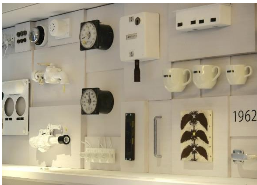
ドトールコーヒーショップ阪神大阪梅田駅店のアート装飾

長きにわたり、みなさまの足として活躍した5001形車両をモチーフに、駅ナカ店舗らしさをお楽しみいただける仕様となっています。