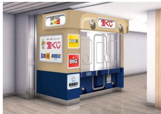
阪神ドリームプラザ梅田店のラッピングイメージ