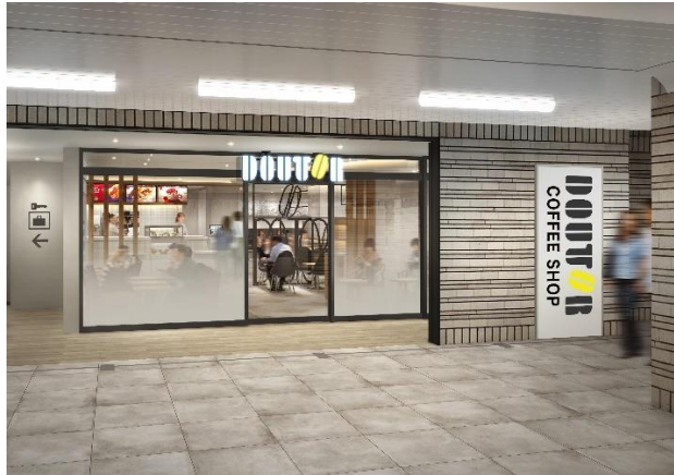
ドトールコーヒーショップ店舗外観イメージ

ドトールコーヒーショップは「すべての今日を、支えていく。」というブランドスローガンのもと、人々の暮らしに欠かせないカフェを目指しています。鉄道も同じく人々の暮らしに欠かせないものであり、長年生活を支えてきた「青胴車」の部品を活用した店内壁面を新たな姿で飾るアート作品には、コーヒー片手にそれを眺め、何気なく当たり前のようにある存在の大切さに気付いてもらえたら、という想いが込められています。