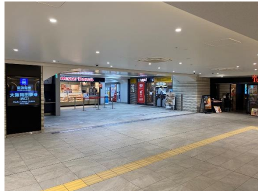
西改札 左：百貨店口 右：西口

駅ナカ店舗でも阪神電車をお楽しみいただけるよう、ドトールコーヒーショップ阪神大阪梅田駅店では、「青銅車」、「ジェット・カー」の愛称で親しまれてきた5001形車両の部品をアートとして内装に活用します。また、阪神ドリームプラザ梅田店では、店舗外装に同車両のラッピングを施します。