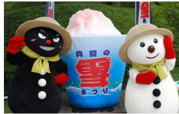
六甲山真夏の雪まつり