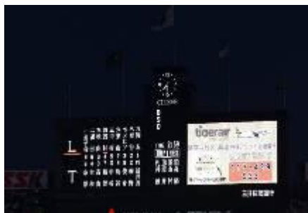
場内ビジョンで当選者の発表（昨年の様子）