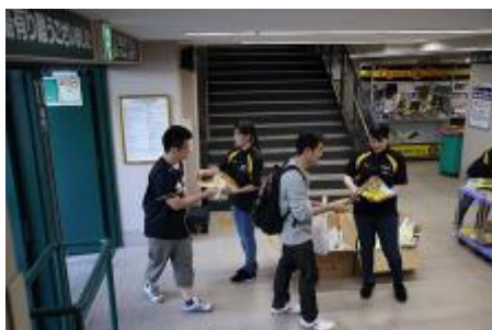
抽選付きうちわの配布（昨年の様子）