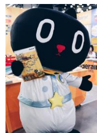
コラボの仲間「クロロ」