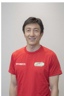
朝原 宣治 (元陸上短距離種目選手)