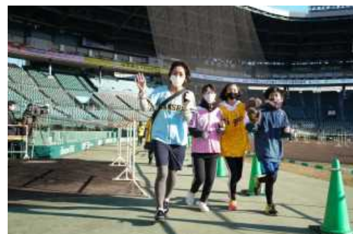
【前回イベントの様子】

なお、本イベントは西宮市、阪神電気鉄道株式会社、三井不動産株式会社、学校法人武庫川学院などを中心に構成する「スポーツを核とした甲子園エリア活性化推進協議会」の事業の一環として開催します。