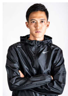
大迫 傑 (陸上長距離種目選手)