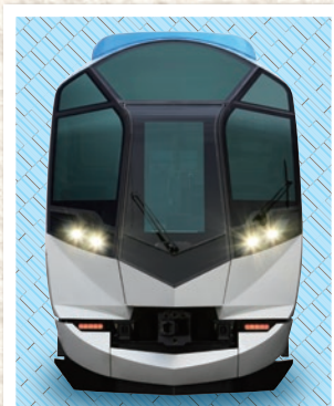
近鉄観光特急「しまかぜ」