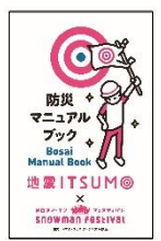
防災マニュアルブック