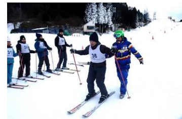
外国人向けスキースクールの様子