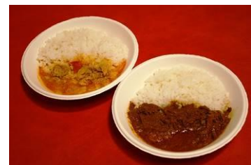
「ハラールフード」メニュー