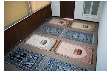
イスラム教徒向け礼拝所 内観