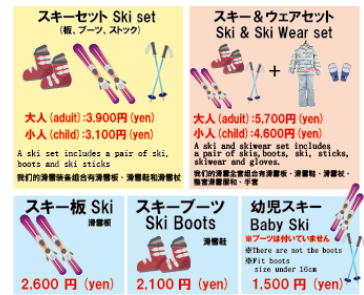
料金案内 POP(英語・中国語表記)

礼拝所設置に伴い、訪日ムスリム旅行団体、個人旅行者の方向けに、「ハラールフード」メニューを販売しております。今後も、国内外からのお客様のニーズに合わせた施設の整備、サービスの拡充に努めて参ります。