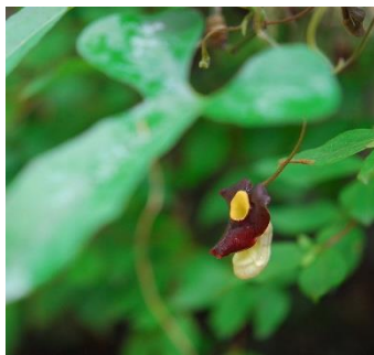
アリマウマノスズクサ(6月)