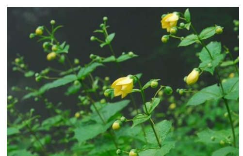
キレンゲショウマ(7～8月)