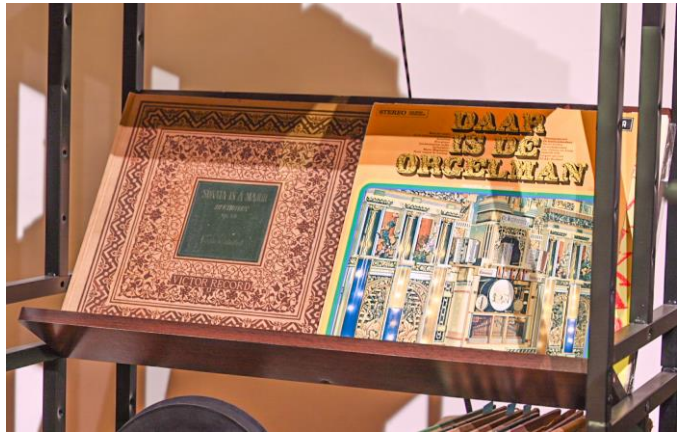
LPレコード『DAAR IS DE ORGELMAN』(右) 表紙にデカップ・ダンス・オルガン“ケンペナー”の写真が掲載されている