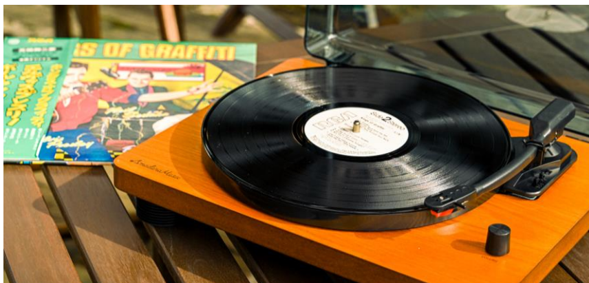
レコードプレーヤーと所蔵の LP レコード

六甲山観光株式会社(本社:神戸市 社長:寺西公彦)が運営する、ROKKO森の音ミュージアム内、森の Café では、2024年1月7日(日)~3月10日(日)の日曜日限定で、「森のレコード喫茶」を開催します。