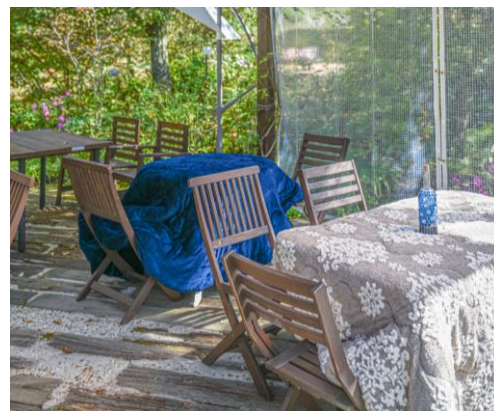
森の Café テラス席のこたつ