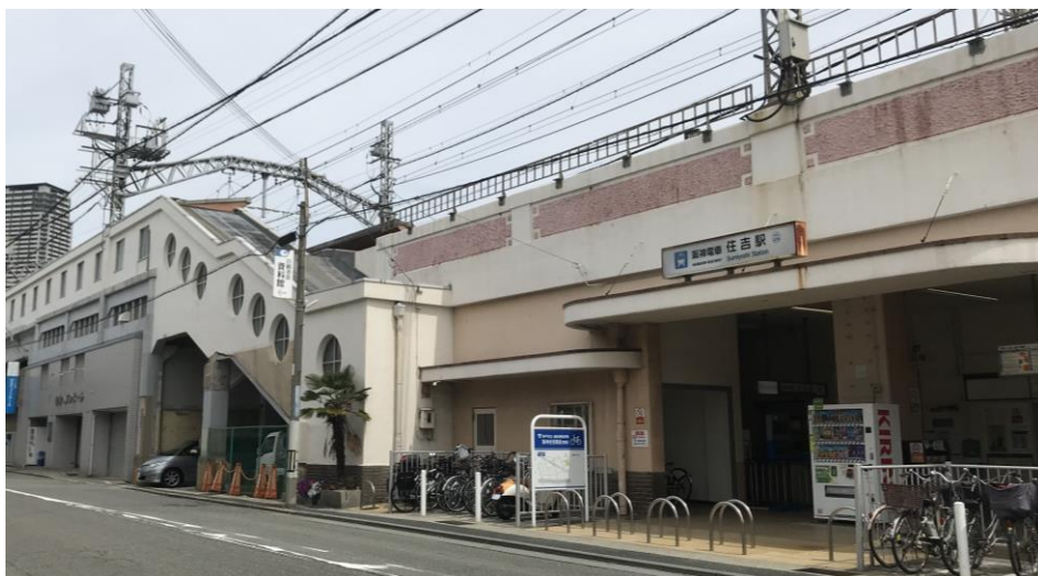
(参考) 現在の住吉駅