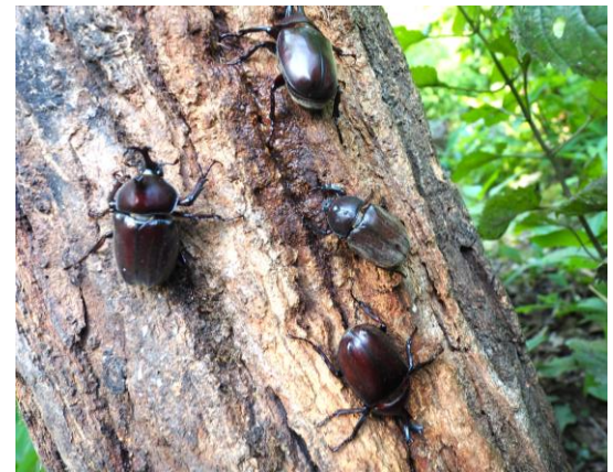
SIKI ガーデンのカブトムシ