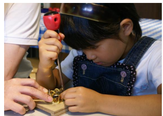
オルゴール組立体験の様子

※天災などの諸事情により内容が変更する場合があります。最新情報はホームページをご覧ください。