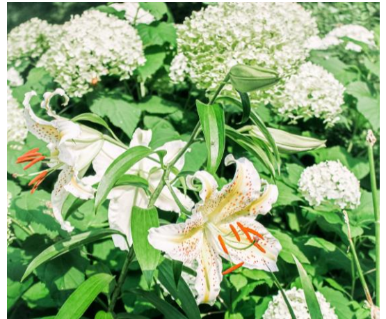
手前:ヤマユリ 奥:アナベル