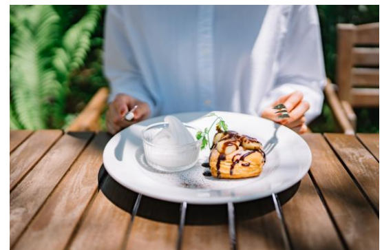
期間限定メニュー チョコバナナデニッシュ