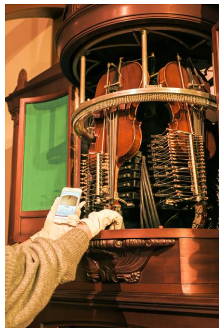
自動演奏バイオリン調弦の様子