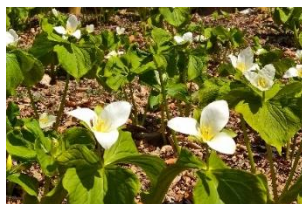
オオバナノエンレイソウ(4月)