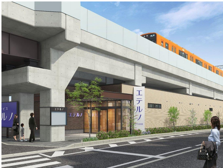
エテルノ鳴尾武庫川 外観イメージ