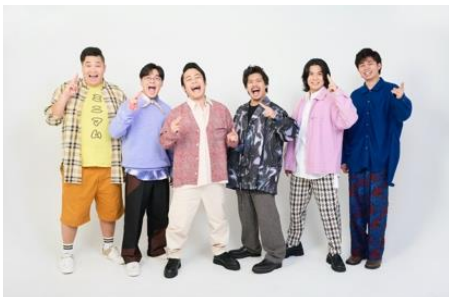
フィッシャーズプロフィール写真

2012年8月に YouTube チャンネルを開設から約8年を経て、2020年 メインチャンネル単独で再生回数100億回を突破。2023年1月時点でメインチャンネルの登録者数は784万人以上。