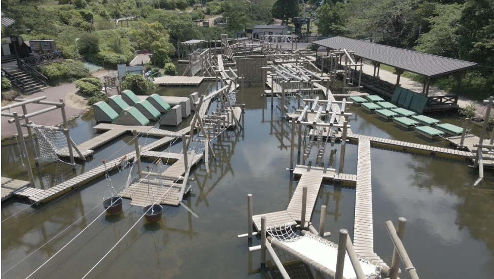
2022シーズンの水上アスレチック wonder amembo(ワンダーアメンボ)の様子

開業3シーズン目となるグリーンニアでは水上アスレチックをフィッシャーズ監修の元、4ポイントのアスレチックを新設し、リニューアルオープンいたします。難易度激ムズのアスレチック遊具は「3秒の壁」、「絶壁ボルダリング」、「白熱！水面ダッシュ」の3つが新登場。また、対決型のアスレチックとして「手押しどすこいバトル」が登場します。