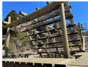
「絶壁ボルダリング」正面