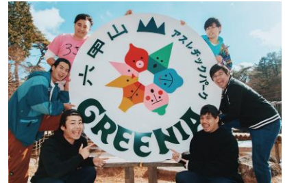
フィッシャーズとグリーンアロゴ