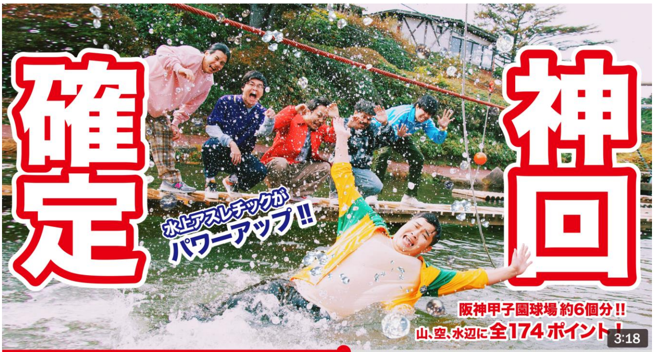
2023シーズン グリーンニアメインビジュアル

今年が開業3シーズン目突入を記念し、「フィッシャーズ」監修の水上アスレチックがパワーアップし、難易度激ムズのアスレチック3つ、対決型のアスレチック1つが池の上に登場します。さらに、オープン日となる2023年3月18日(土)にはオープニングセレモニーを開催。「フィッシャーズ」のメンバーも登場(※2)し、ご来場のみなさまと一緒にシーズンオープンをお祝いします。