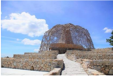
自然体感展望台 六甲枝垂れ

「六甲ミーツ・アート芸術散歩」は、六甲山上の観光施設を主な会場としています。オープンエアな環境で六甲山の自然とアート作品を楽しみながら、会場となる各施設それぞれの魅力もお楽しみいただけます。各会場は、六甲山上バス（路線バス：有料）の他、徒歩での移動も可能です。