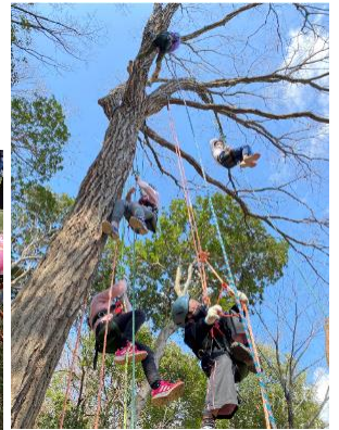
カヌー体験、ツリーイング (イメージ)