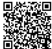
テーマソング「きこえる、きこえる」