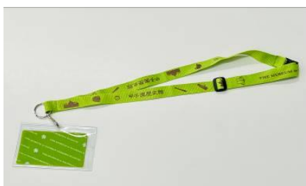
(オリジナルチケットホルダー)