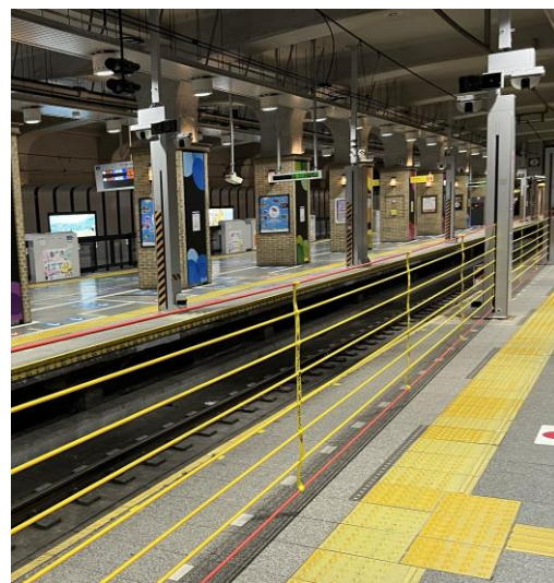
< 2 番線ホームの昇降ロープ式ホーム柵 >

(注) 黄色い線の外側は、ロープが昇降するため、ご通行やお待ち合わせにはご注意ください。