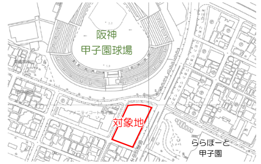
位置図(西宮市地理情報システムより引用)