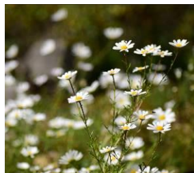
イワギク (10月下旬まで)