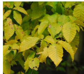
イヌブナ (11月上旬まで)