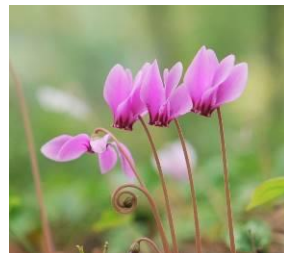
シクラメン・ヘデリフォリウム (11月上旬まで)