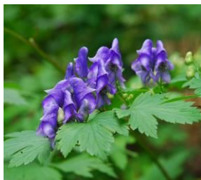
ヤマトリカブト (10月下旬まで)