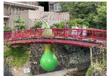
有馬温泉 太閤の湯賞 (対象: 全作品) 松蔭中学校・高等学校 美術部 「愛をこめてひょうたんを〜青春〜」

有馬温泉 太閤の湯賞 対象: 全作品 (賞金10万円) 提供: 株式会社有馬ビューホテル アーティスト名: 松蔭中学校・高等学校 美術部 (しょういんちゅうがっこう・こうとうがっこうびじゅつぶ) 作品名: 愛をこめてひょうたんを〜青春〜 (あいをこめてひょうたんを〜あおはる〜) 展示会場名: サテライト会場 有馬温泉エリア