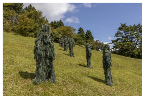
昨年の神戸市長賞 (対象:公募アーティストの作品) KIMU「green on green」2020年