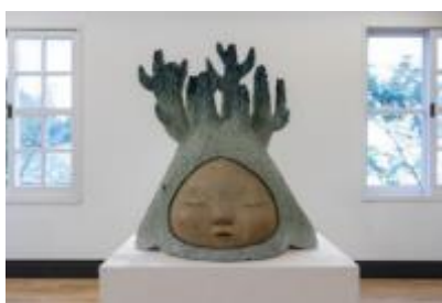
中村萌《Grow in silence》 2020年 六甲山サイレンスリゾート