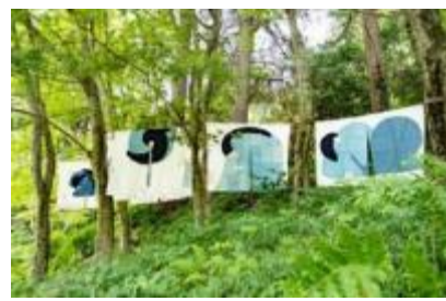
史枝《連なる思い》 2020年 六甲高山植物園