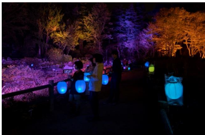
高橋匡太《Glow with Night Garden Project in Rokko 提灯行列ランドスケープ》2019年 六甲高山植物園