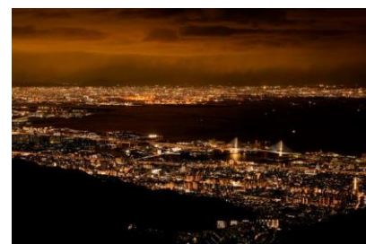
六甲ガーデンテラスエリア 夜景

六甲ガーデンテラスエリアでも1,000万ドルの夜景と共に楽しめる夜間鑑賞可能作品を公開します。