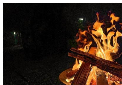
焚き火で夜市 in 六甲山(イメージ)

【会場】 ROKKO 森の音ミュージアム 六甲高山植物園 六甲ガーデンテラスエリア