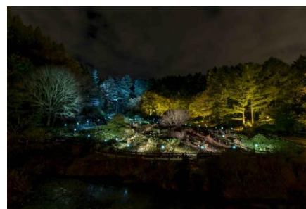
高橋匡太《Glow with Night Garden Project in Rokko 提灯行列ランドスケープ》2020年 六甲高山植物園