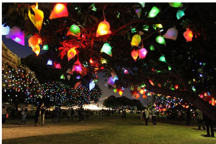
高橋匡太《ひかりの実》2011年 山下公園、横浜市、神奈川、photo 村上美都 (展示イメージ)

また六甲ガーデンテラスエリアでも1,000万ドルの夜景と共に楽しめる夜間鑑賞可能な作品を公開します。