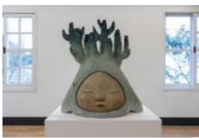
中村萌《Grow in silence》 2020年 六甲山サイレンスリゾート