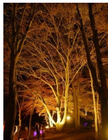
六甲高山植物園 紅葉ライトアップの様子

【料金】 「六甲ミーツ・アート芸術散歩 2021 鑑賞パスポート」または「六甲高山植物園」(大人700円、小人350円)の単施設入園券