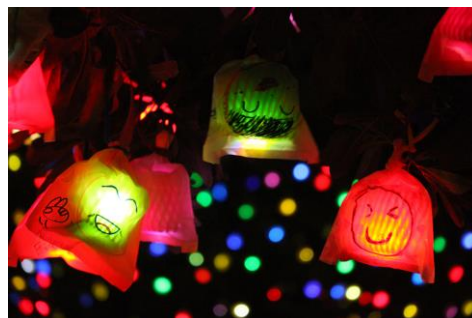
《ひかりの実》(展示イメージ)

また過去作品にはなかった新たな要素として音楽家 mica bando が手がけた音楽をエリア内で流し、光と温かな癒しの空間を楽しんでいただけます。