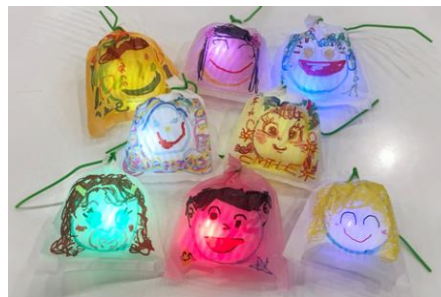
《ひかりの実》(ワークショップのイメージ)