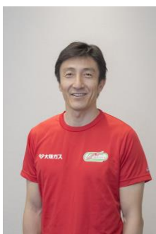
朝原 宣治 (元陸上短距離種目選手)