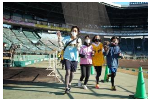
【前回イベントの様子】

なお、本イベントは西宮市、阪神電気鉄道株式会社、三井不動産株式会社、学校法人武庫川学院などを中心に構成する「スポーツを核とした甲子園エリア活性化推進協議会」の事業の一環として開催します。