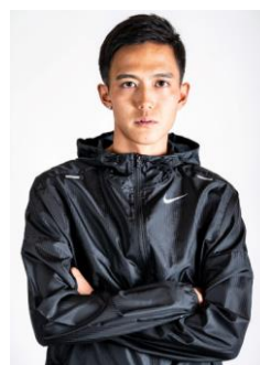
大迫 傑 (陸上長距離種目選手)