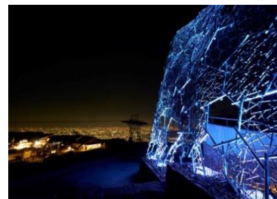
『六甲山 Lightscape in Rokko 夏バージョン「夏は夜」』