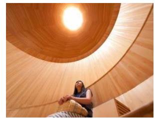
④【氷室開き／冷風体験】