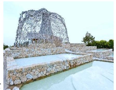
自然体感展望台 六甲枝垂れ 外観

通常「氷室」内部は一般公開していませんが、 7月13日(火)には氷室の内部を一般の方にも特別に公開(要予約・先着順) します。