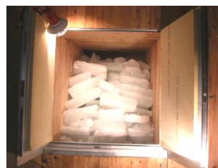
③【氷室に氷を運搬・貯蔵】