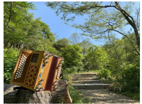
SIKI ガーデンコンサート イメージ