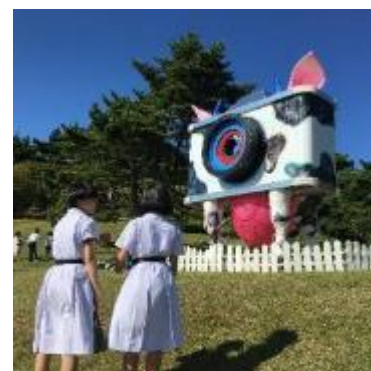
「六甲ハイ・チーズ！」 六甲ミーツ・アート芸術散歩 2017