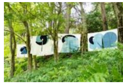
史枝《連なる思い》 2020年 六甲高山植物園

※2021年6月30日(水)現在の情報です。変更が生じた場合はwebサイト ( https://www.rokkosan.com/art2021/ ) で発表します。新型コロナウイルス感染症の状況により変更する場合があります。