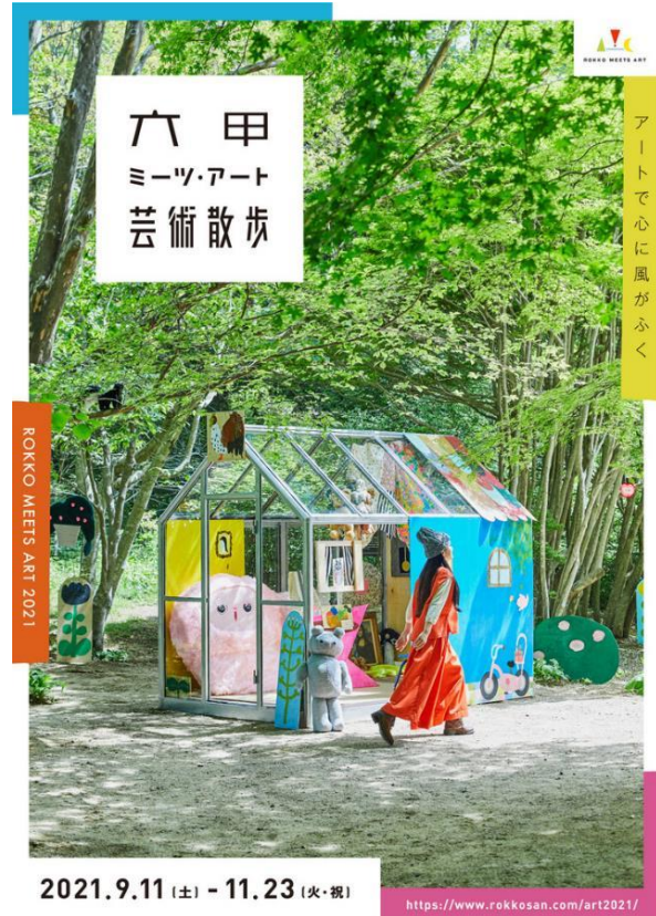
Art work: 長井朋子《小さな家 The Little House》2021 ©Tomoko Nagai, Courtesy of Tomio Koyama Gallery / Photography: Akira Yamaguchi / Design: Akihiro Hama (KOBE DESIGN CENTER)