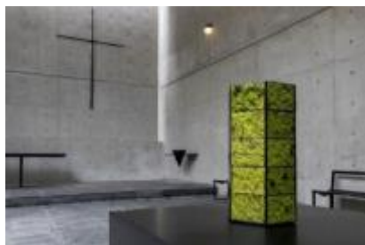
山城大督《Monitor Ball》ver. Rokko) 2020年 風の教会