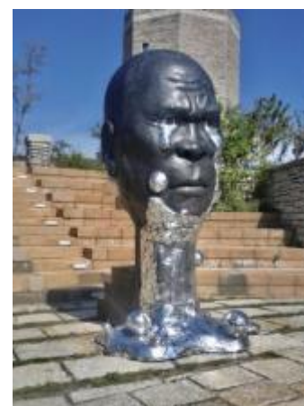
「空を見てたら涙が出ちゃいました。」 六甲ミーツ・アート芸術散歩 2017