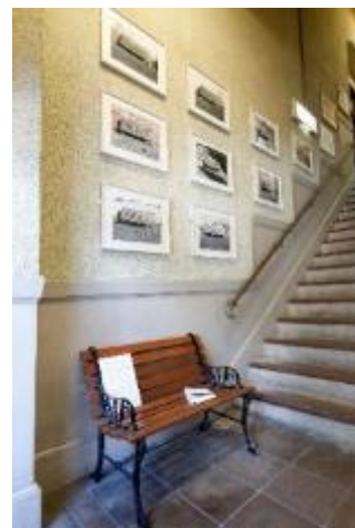
「景観ベンチ」マリオン・ポーゼン 六甲ミーツ・アート 芸術散歩 2020