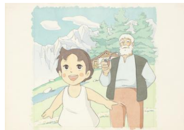
小田部羊一氏 原画