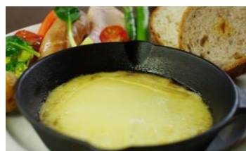
「ラクレットチーズプレート」