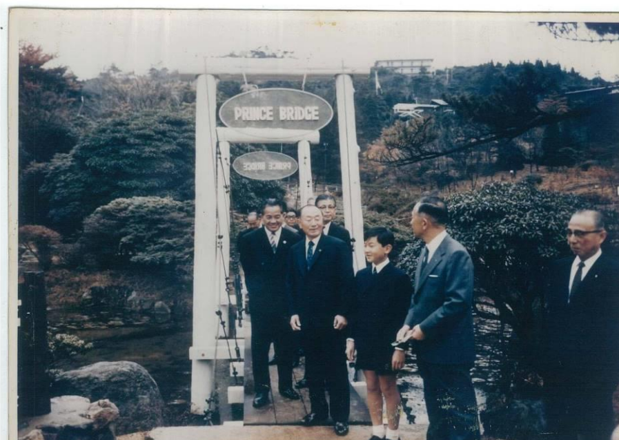
1971年11月10日 徳仁皇太子殿下(当時)