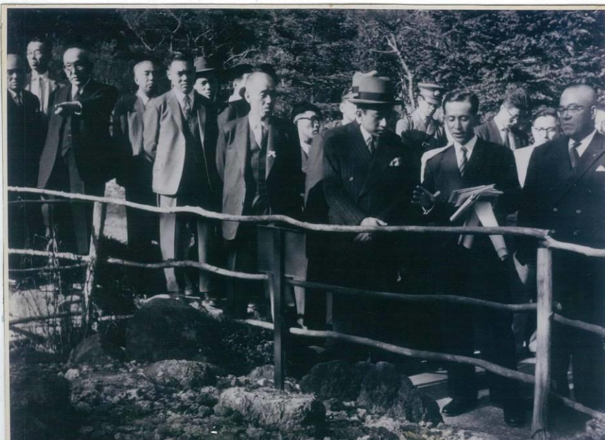
1958年10月29日 明仁皇太子殿下(当時)