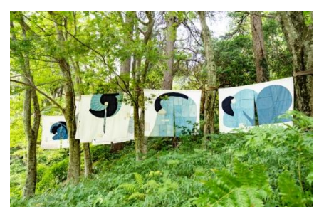
史枝《連なる思い》 2020年 六甲高山植物園