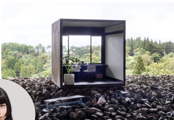
六甲ミーツ・アート公募大賞 グランプリ作品 上坂直《六甲景鏡》 2020年 自然体感展望台 六甲枝垂れ