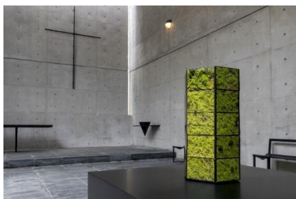
山城大督《『Monitor Ball』ver. Rokko》 2020年 風の教会

六甲山のエリア特性をじっくりと読み込み、自然や景観、歴史を採り入れた作品を各会場に展示します。