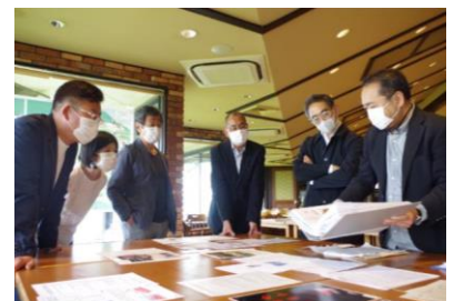
公募審査会の様子