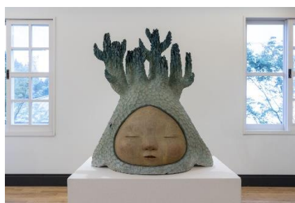
中村萌《Grow in silence》 2020年 六甲山サイレンスリゾート