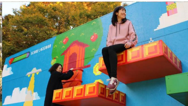
※写真は建設中のヤッホイの様子