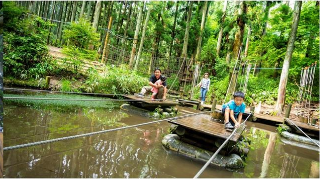
※写真は既設エリア ワンダーヤマンボーの岸へむかって