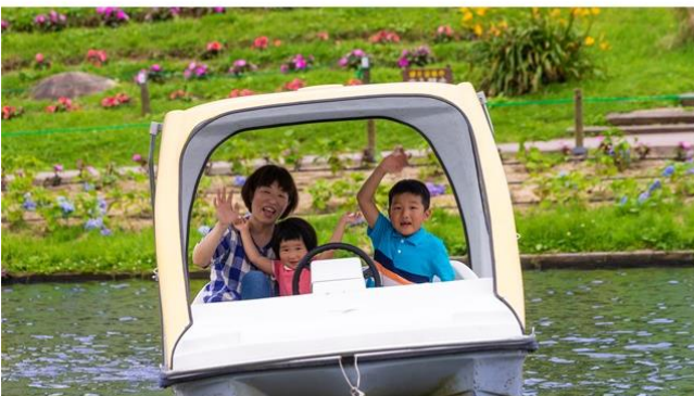
※写真は既設エリア マウントキングのペダルボート

※旧六甲山カンツリーハウス ゴーカート・ペダルボート・トランポリン・わんぱくスキー・パターゴルフ