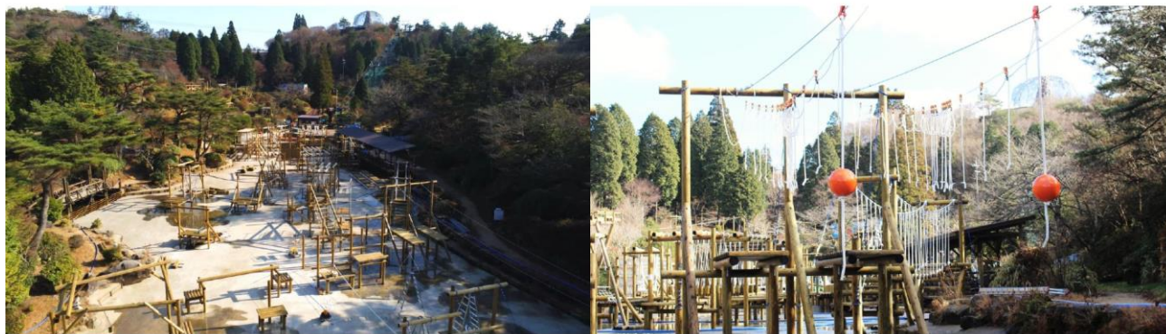
※写真は建設中のワンダーアメンボの様子（完成後に水をはります）

ワンダーアメンボは「フィッシャーズ」が監修した30ポイントのスリル溢れる水上アスレチック。水に落ちずにゴールできるか？落ちても安心、シャワー室完備。