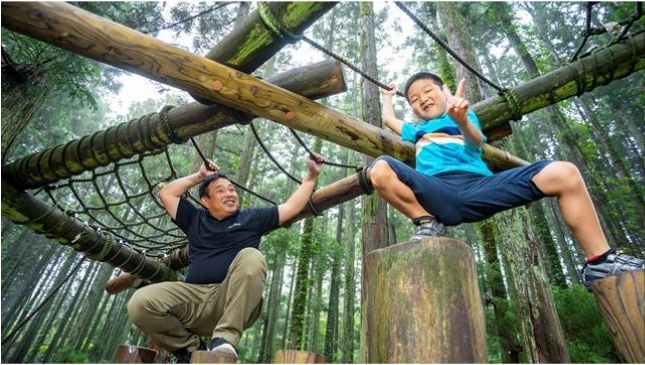
※写真は既設エリア ワンダーヤマンボーのうなだれぶらさがり