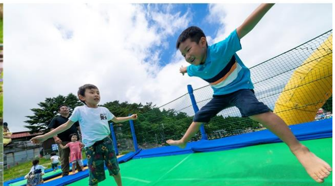
※写真は既設エリア マウントキングのトランポリン