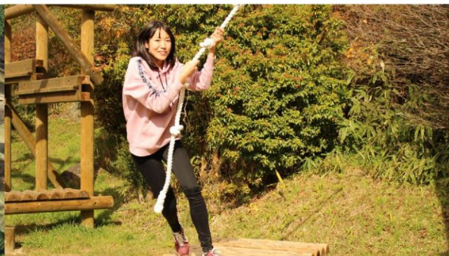
※写真は建設中のデカイリキの様子