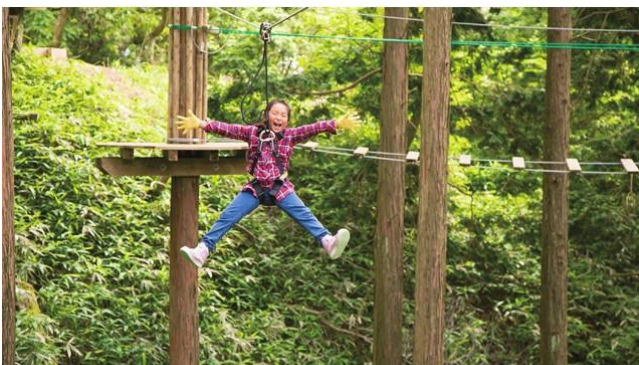
※写真は既設エリア メチャフォレストのジップスライド

メチャフォレストは安全器具を装着し、樹上最大15mの高さで遊ぶ非日常体験が魅力。ジップスライドやロープ、丸太を駆使し、37ポイントの空中アスレチックが楽しめる。