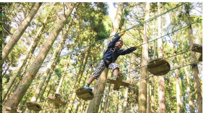
※写真は既設エリア メチャフォレストのハーブシャモニックロッシング