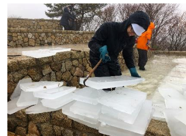
2019年氷の切り出しの様子

【備考】 当日は、六甲枝垂れにご入場のお客さまにも「氷の切り出し」を見学していただけます。氷を貯蔵する「氷室」は、通常は一般公開していない部屋ですが、 1月20日(水) 10:00～14:00に限り、一般のお客さまにも「氷室」を特別公開 します。