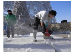
厚い氷が張ると、氷の切り出しを行う