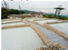
雨水を溜める為の「氷棚」

展望台東側に位置する「氷棚」では、雨水を溜めて冬の間に天然の氷を作ります。この氷をのこぎりやチェーンソーを使って切り出し、展望台内部にある「氷室(ひむろ)」に貯蔵します。夏に冷風体験をするためには、「氷棚 6面×3回の切り出し」程度の氷が必要な為、この冬、数回にわたって切り出し作業を行う予定です。