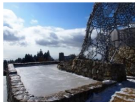
冬は「氷棚」に溜まった雨水が凍る