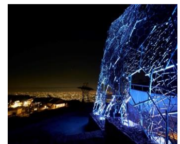
六甲山光のアート 開催時の様子