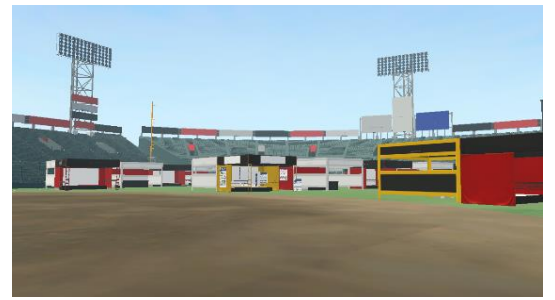
デジタル甲子園のイメージ