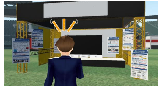
来場者アバターの目線のイメージ