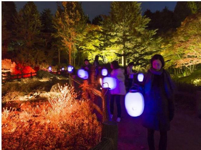
高橋匡太「Glow with Night Garden Project in Rokko 提灯行列ランドスケープ」2019年 六甲高山植物園