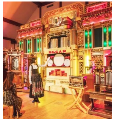
ミュージアムコンサート(イメージ)

【演奏楽器例】 ・ポリフォン54型“ミカド”(ディスク・オルゴール/1900年頃/ドイツ製) ・ロッホマン・オリジナル172型(ディスク・オルゴール/1904年頃/ドイツ製)