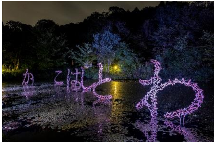
伏見雅之「過去とはどこか」2020年 六甲オルゴールミュージアム

下記期間中、ムットーニの作品上演に加え、「六甲ミーツ・アート 芸術散歩 2020」の野外アート作品をライトアップします。期間限定で夜間のみ鑑賞できる作品の展示も行います。1000万ドルの夜景が楽しめる時間帯にアート作品が鑑賞できます。