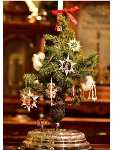
クリスマス・ツリー立て

【演奏曲目例】 ・ジングルベル(ジェームズ・ロード・ピアポント作曲) ・オー・ホーリー・ナイト(アドルフ・アダン作曲)