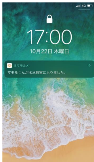
&lt;プッシュ通知イメージ&gt;